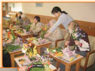
フラワーアレンジメント