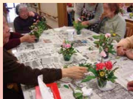
フラワー アレンジメント