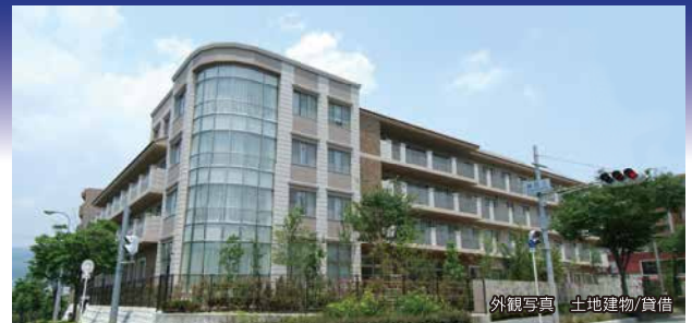
外観写真 土地建物/賃借

少人数のユニットケア方式 24時間365日看護スタッフ (注) 常駐 近隣医療機関とのネットワークで安心の医療支援体制