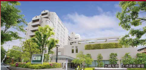
外観写真 土地建物/賃借

ゆとりのある居住空間 専任トレーナーによる健康づくりサービス 緊急時も安心の医療支援体制