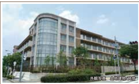
外観写真 土地建物/賃借