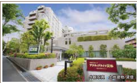
外観写真 土地建物/賃借