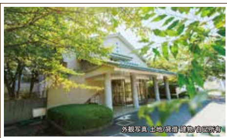
外観写真 土地/賃借 建物/自己所有